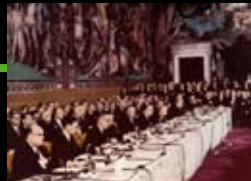
1957 Römische Verträge Europäische Wirtschafts- gemeinschaft, Euratom