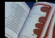
1997 Amsterdamer Vertrag