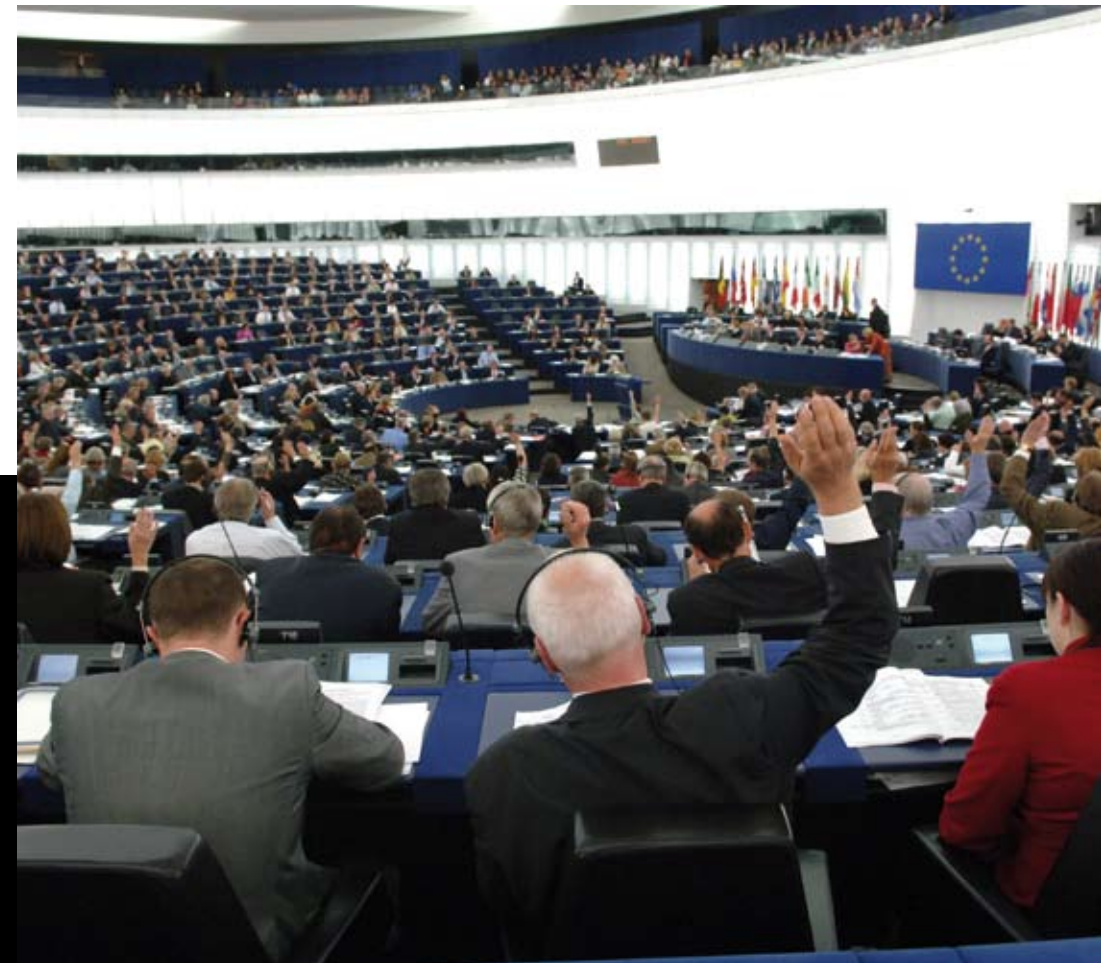
Abstimmungen im Europäischen Parlament in Straßburg