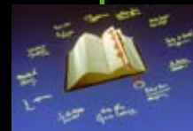
1992 Maastrichter Vertrag