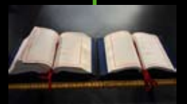
2001 Vertrag von Nizza