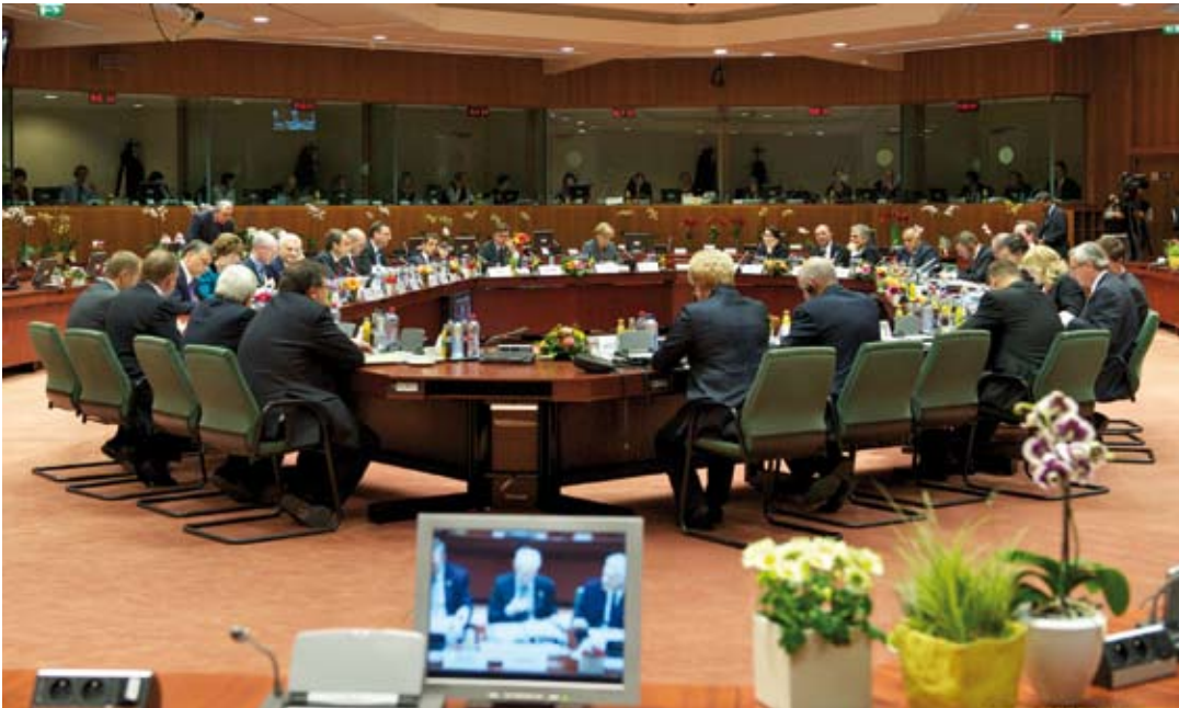
Sitzung des Europäischen Rats, 28./29. Oktober 2010, Brüssel.

Der Vertrag von Lissabon bringt endlich mehr Offenheit und Entscheidungsfreudigkeit in den Alltag der Europäischen Union und öffnet die Türen ein Stück in die bisher verschlossenen Hinterzimmer des Rates der Europäischen Union.